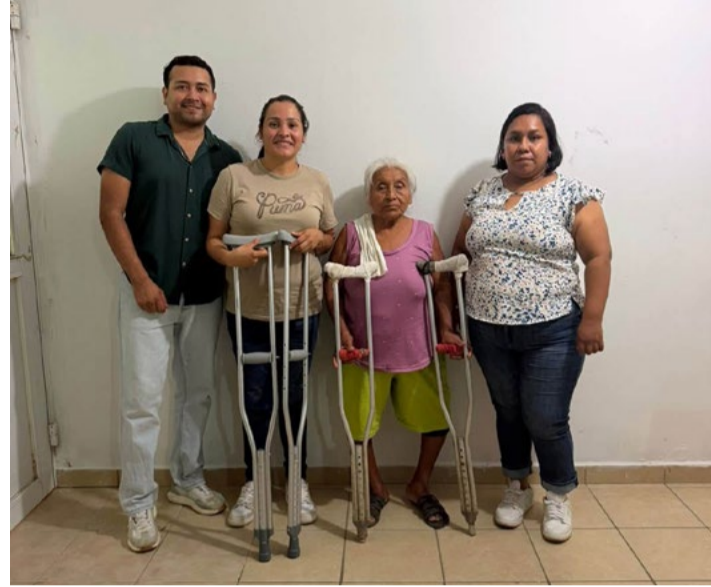
humano, escuchando a la ciudadanía y ofreciendo respuestas que generan un impacto positivo en la

vida de las familias, ya que detrás de cada apoyo existe una historia de esfuerzo, esperanza y superación.