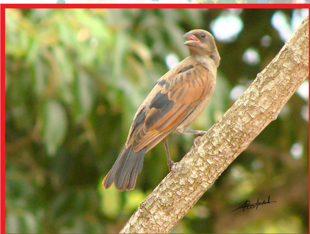
MOLOTHRUS BONARIENSIS VAQUERITO MIRLO

Habita desde el sur de Estados Unidos, todo México hasta Centro América