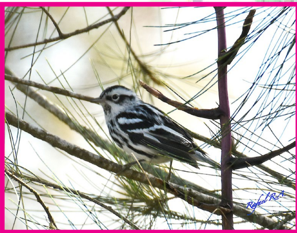
MNIOTILTA VARIA REINITA TREPADORA