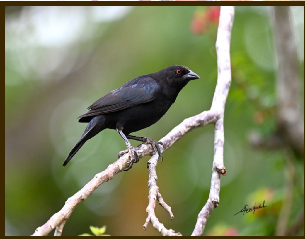
MOLOTHRUS AENUS TORO OJOS ROJOS

Con rayas blanca y negras, en la nuca y espalda. El macho en la etapa reproductora tiene corona negra y una raya amplia color blanco en el pecho, con la cola y alas negras con manchas blancas en la plumas distales y vientre blanco. Se reproducen en el oeste de Estados Unidos y Canadá, en invierno habita en México, Centro América y el norte de América del Sur.