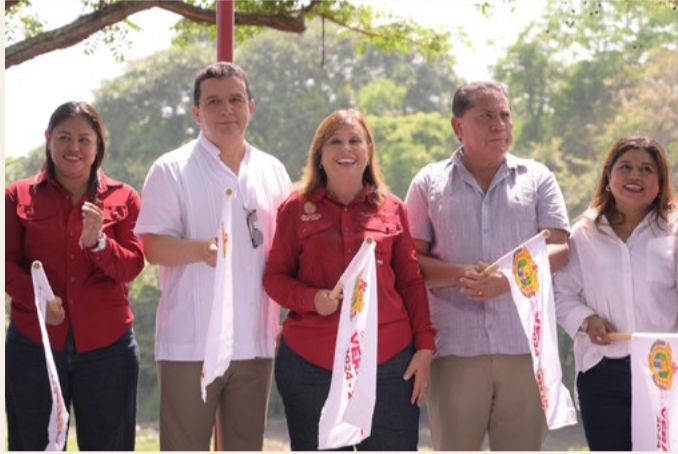
REDACCIÓN NORESTE Naranjos, Veracruz

Respaldado por la Conagua y será operado por la CAEV.