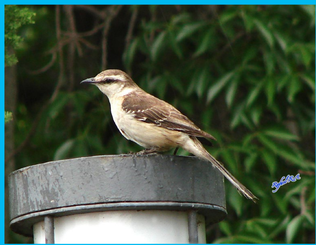
MIMUS SATURNINUS CALANDRÍA GRANDE

Bastante comun en la Patagonia Argentina