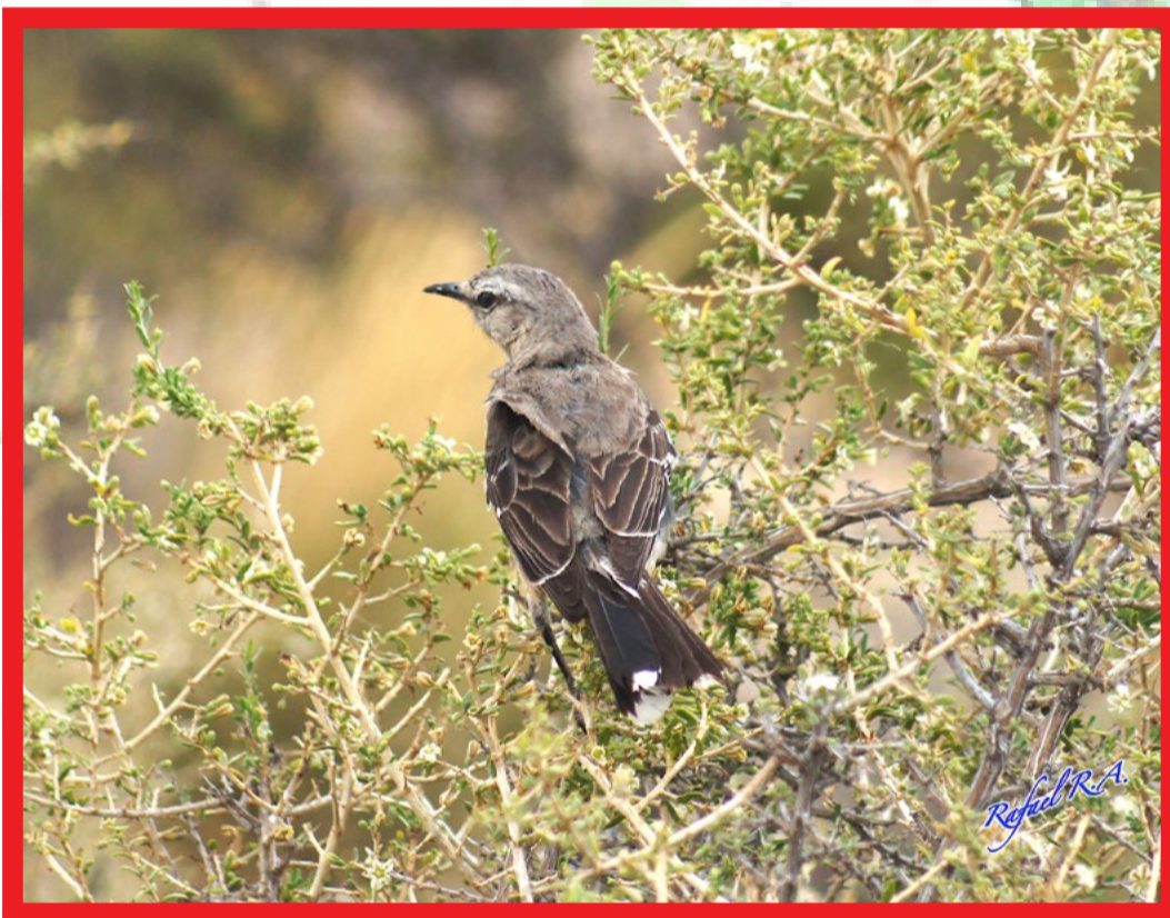
MIMUS PATAGÓNICUS CALANDRIA PATAGÓNICA

Mide aproximadamente 23 cm. De cejas palidas, partes inferiores beige-gris barras alares blancas y manchas blancas en la cola, corre bien en el suelo con la cola levantada