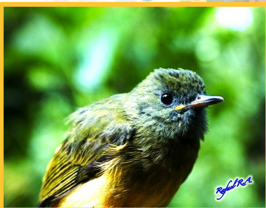
MIONECTES OLEAGINEUS MOSQUERO ACEITUNADO

Bastante comun en la Patagonia Argentina