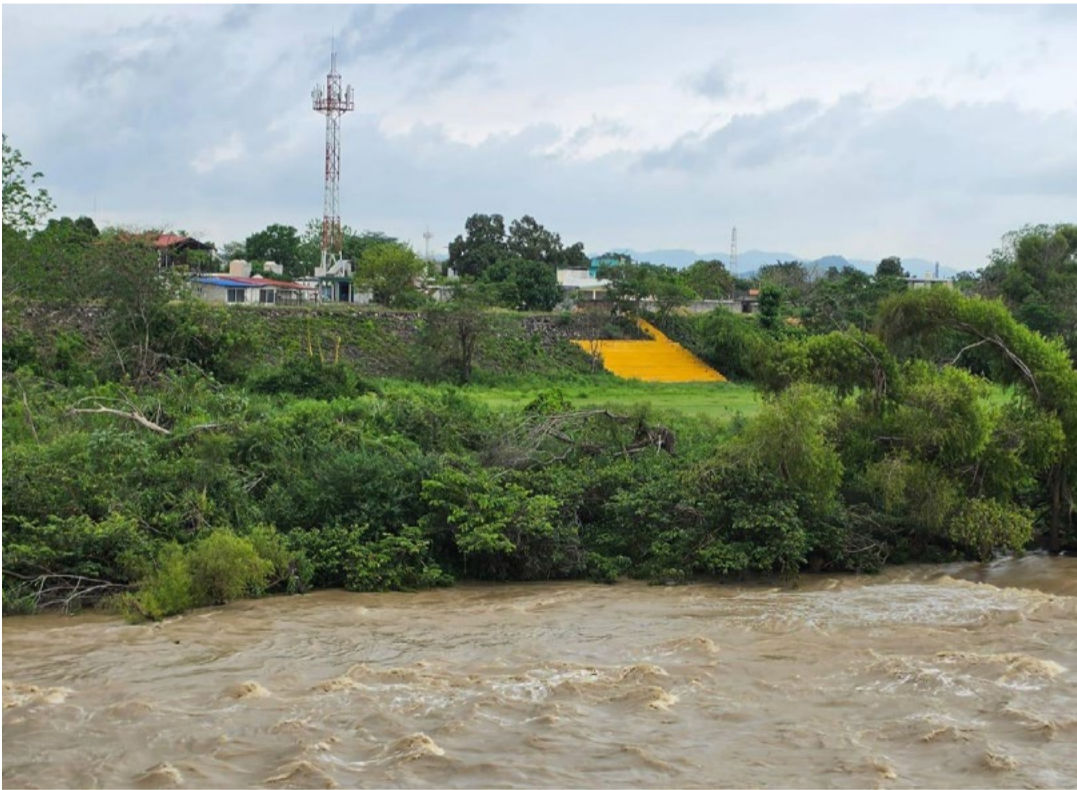
ISAAC CARBALLO Poza Rica, Veracruz

Las lluvias registradas en la cuenca alta provocaron el incremento de sedimentos en el afluente, afectando el suministro a Poza Rica.