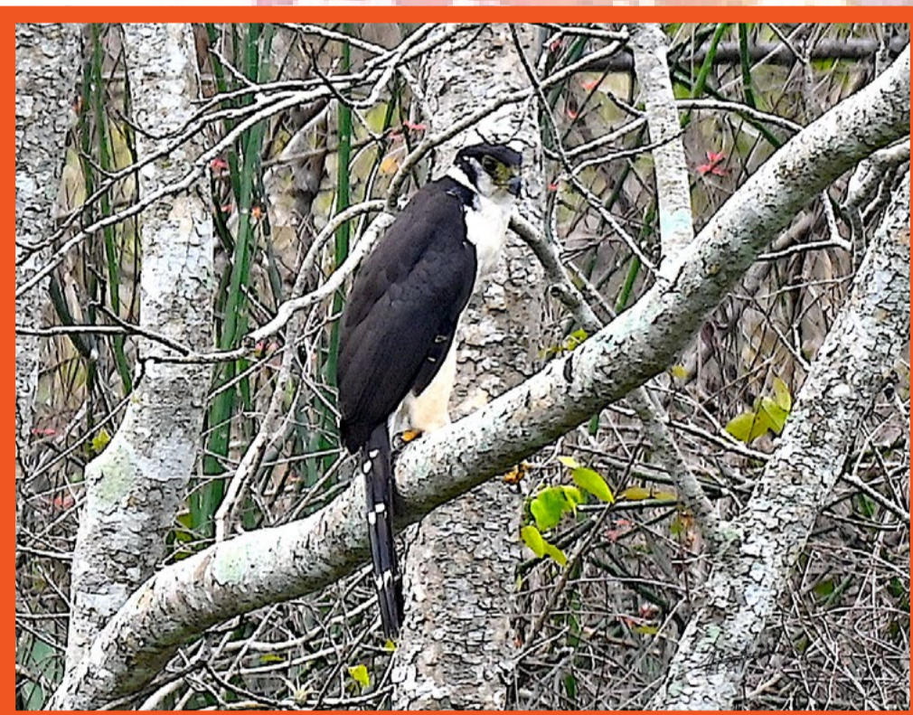
MICRASTUR SEMITORQUATUS HALCÓN MONTÉS COLLAREJO

Ave rapaz, de plumas color crema en garganta y pecho con un barrado oscuro. pocas veces vista y tierras bajas y ladereas. Se le puede detectar por su llamado que pareciera ladrido agudo. Facilmente queda perchado y muy quieto en niveles medios o bajos al interior del bosque. Se le encuentra en México en la región del Golfo has Chiapas, en América Central y en Sud Américaca hasta el sur de Brasil.