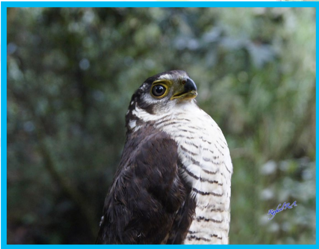
MICRASTUR RUFICOLLIS HALCÓN MONTES CHICO

Ave rapaz, de plumas color crema en garganta y pecho con un barrado oscuro. pocas veces vista y tierras bajas y ladereas. Se le puede detectar por su llamado que pareciera ladrido agudo. Facilmente queda perchado y muy quieto en niveles medios o bajos al interior del bosque. Se le encuentra en México en la región del Golfo has Chiapas, en América Central y en Sud Américaca hasta el sur de Brasil.