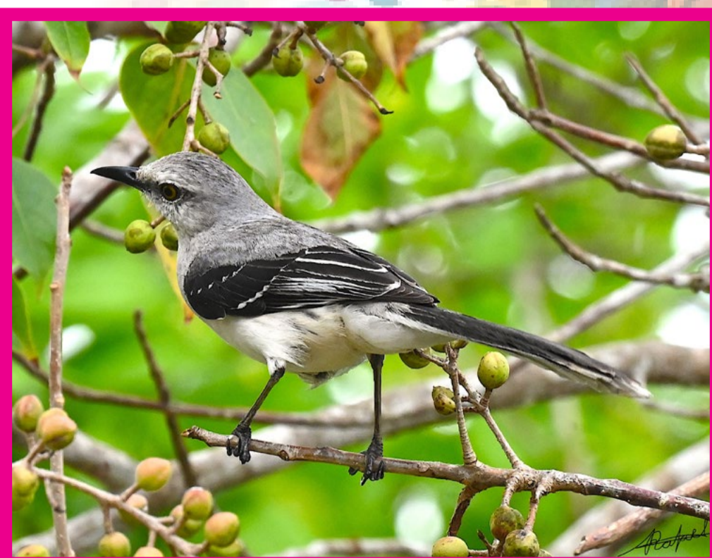
MIMUS GILVUS CENZONTLE TROPICAL

Mide entre 51 y 58,5 cm con una envergadura de has 94 cm Su plumas superiores son generalmente gris oscuro o negro, partes inferiores blancas o crema pálido, con franjas horizontales oscura. La zona de entre sus ojos sin plumas de color gris verdoso y de patas amarillas. Se le localiza en las vertientes oriental y occidental de México has sud América, al sur de Brasil y norte de Argentina.