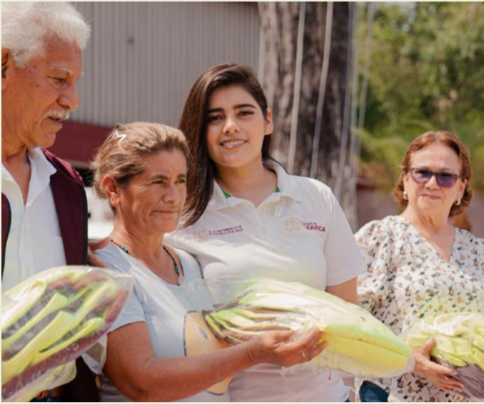
REDACCIÓN NORESTE Poza Rica, Veracruz

Ayuntamiento convierte el buen manejo de los recursos públicos en resultados para la ciudad