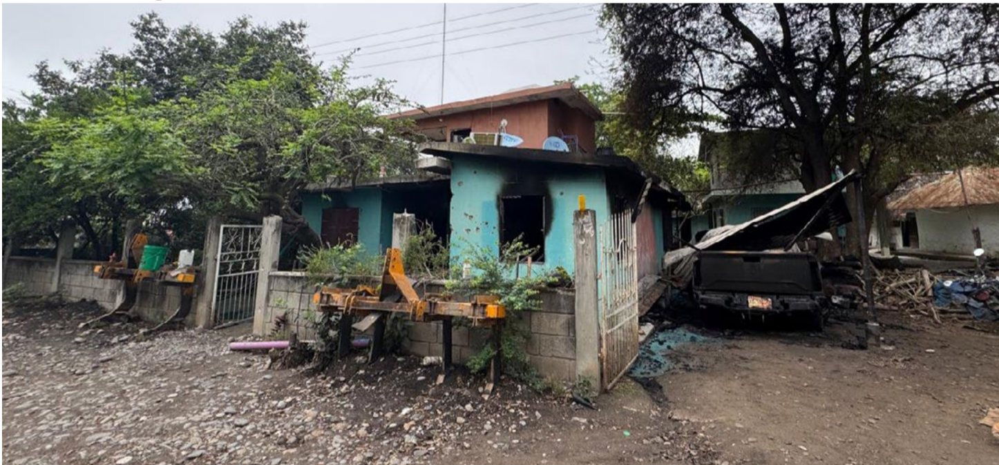
REDACCIÓN NORESTE El Higo, Veracruz

Una intensa movilización y momentos de temor se registraron la mañana de este lunes en la comunidad de Carolina Los Marcos, municipio de El Higo, luego de que presuntamente sujetos armados atacaran a balazos una vivienda y posteriormente le prendieran fuego.