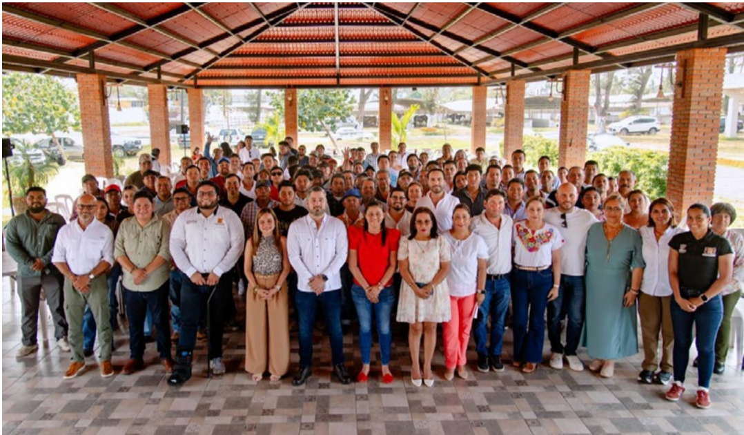
REDACCIÓN NORESTE Tuxpan, Veracruz

Celebran su esfuerzo y trayectoria con convivencia, reconocimientos y rifa de regalos