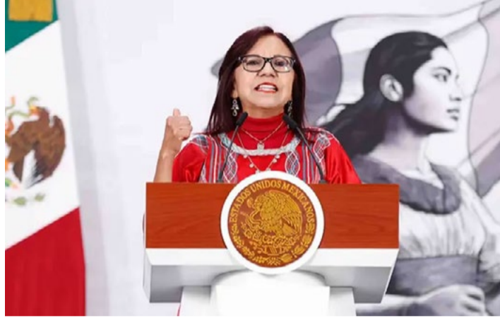
Ciudad de México.

El 26 de abril, Morena emitió su convocatoria para realizar la séptima sesión del Congreso Nacional en la