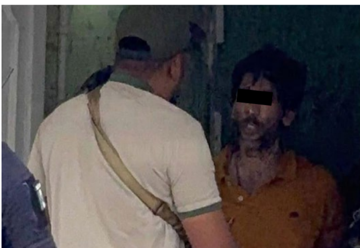
Papantla, Veracruz