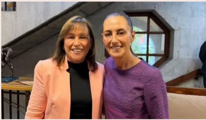
REDACCIÓN NORESTE Ciudad de México

La gobernadora Rocío Nahle participó en la sesión del Gabinete de Seguridad del Gobierno de México, encabezada por la presidenta Claudia Sheinbaum Pardo, como parte del esquema de