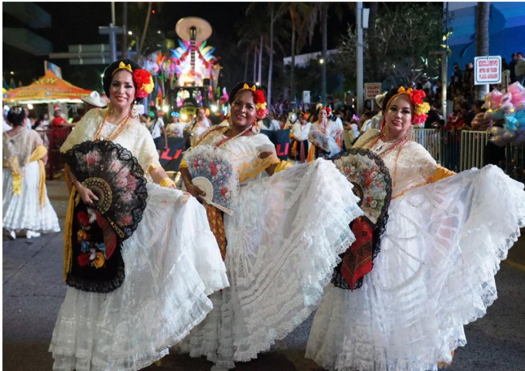
REDACCIÓN NORESTE Xalapa, Veracruz

El Gobierno de Veracruz, a través de la Secretaría de Cultura de Veracruz, participará con una muestra de su riqueza cultural, gastronómica y tradicional en Ventana a México y en la 50 edición del Tianguis Turístico 2026, que se